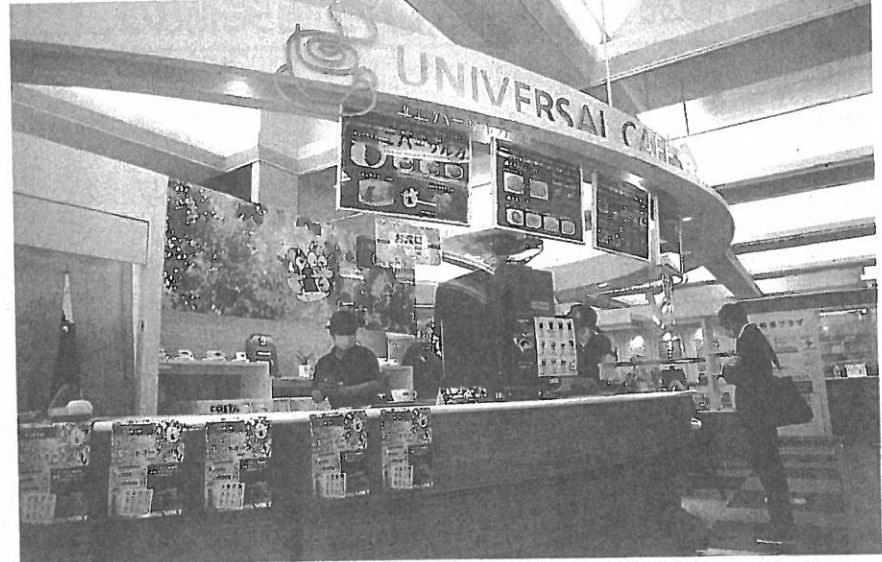
福岡市役所1階ロビーにリニューアルオープンしたユニバーサルカフェ